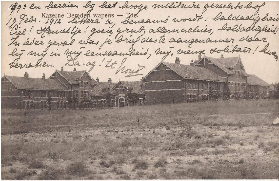
Prentbriefkaart 28 februari 1914