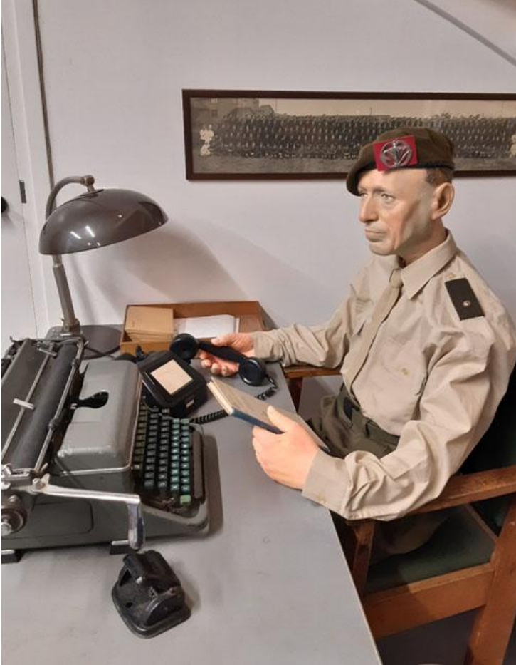
Adjudant achter bureau

Garnizoensmuseum De Smederij. In de loop van de tijd gaan we bezien of en hoe we die figuren – of in ieder geval de prachtige karakteristiek hoofden – kunnen gebruiken in onze vaste opstelling. Eén hoofd zit inmiddels op een Duitse etalagefiguur op de Hooizolder. En één complete figuur zit nu als adjudant achter het bureau in de Mess.