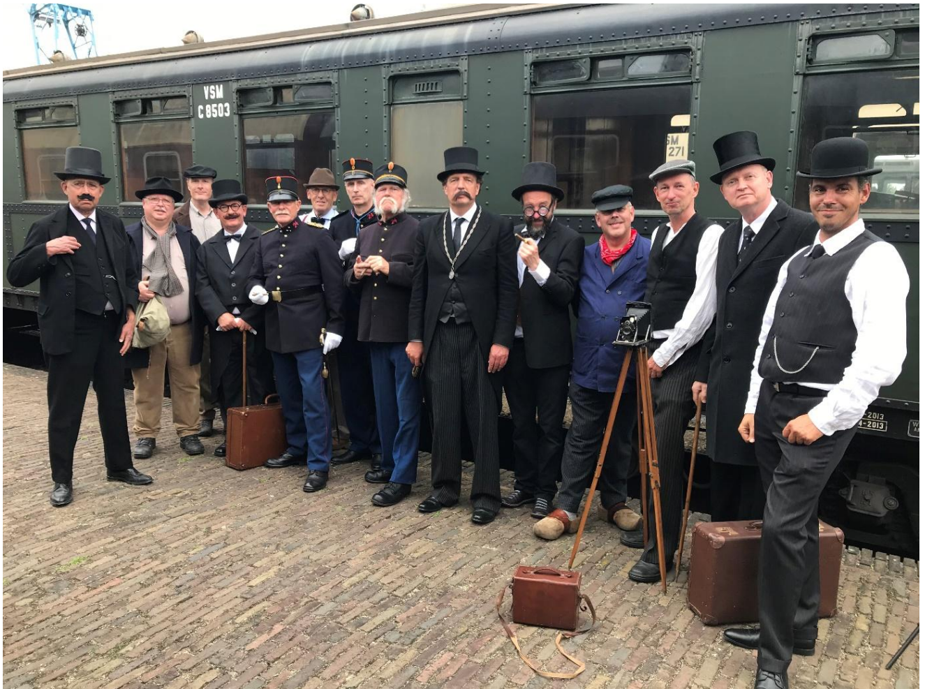
Vrijwilligers van het Platform als figuranten, samen met de burgemeester

Op zaterdag 3 juli hebben meerdere leden van ons Platform als figurant deelgenomen aan de opnames voor de film “Blijven, komen en gaan” van Arno Setz. De film gaat over de grote veranderingen die Ede heeft ondergaan in de afgelopen ruim 100 jaar. Op zaterdag 13 november vond in Pathé Ede de première plaats van deze (vernieuwde) film. Meerdere Platformers waren hierbij aanwezig. Het is een leuke film geworden die een mooi beeld schetst van het heidedorp Ede van toen, en de kleurrijke gemeente die het nu geworden is.