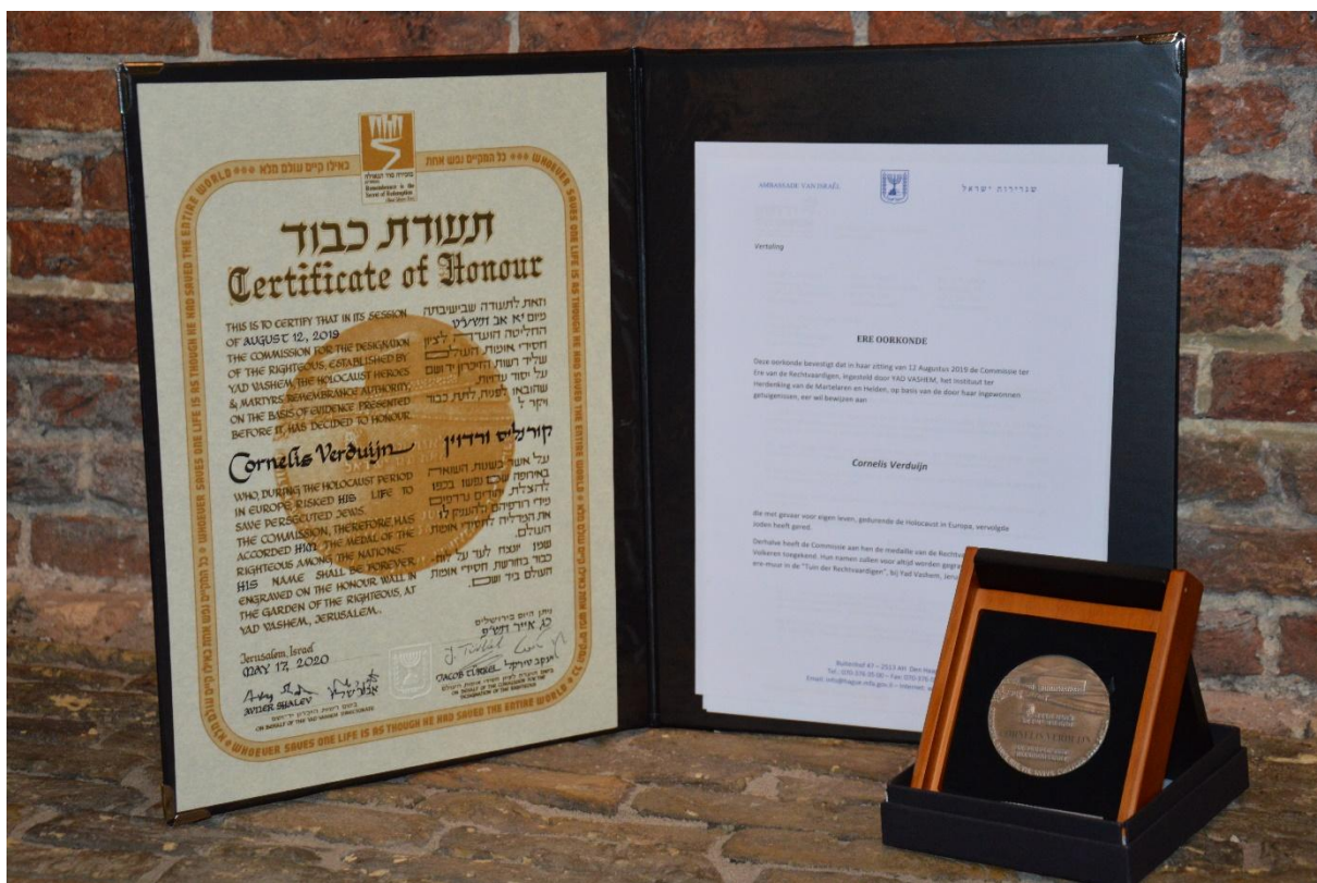
Yad Vashem onderscheiding Cornelis Verduijn