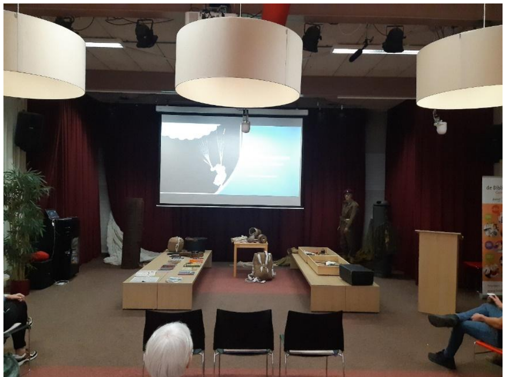
Lezing "Geheim Agenten op de Veluwe" in Nijkerk

Inmiddels heeft ook de Volksuniversiteit Wageningen het voornemen om deze lezing op te nemen in haar jaarprogramma 2021 – 2022.