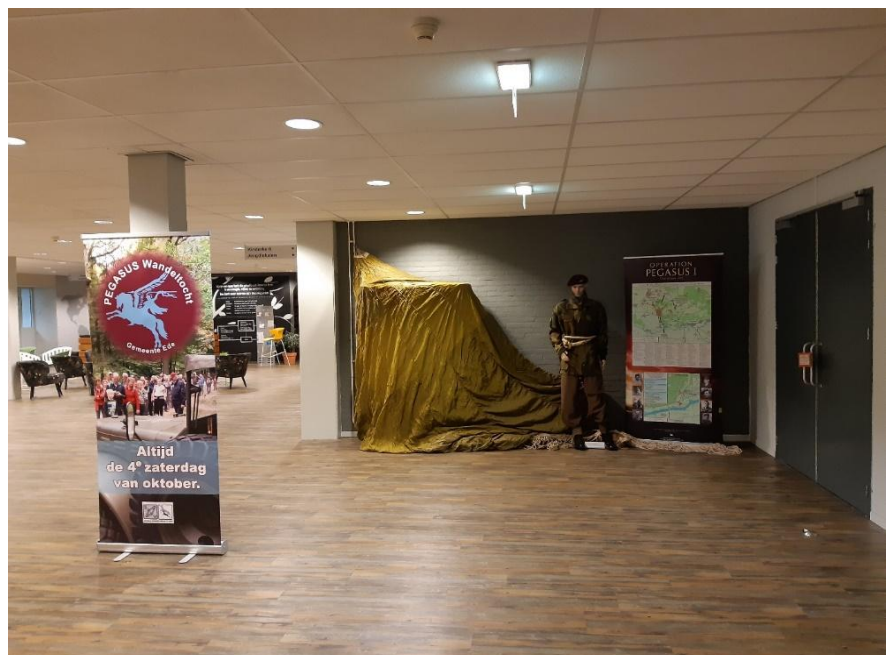
Materiaal bij finish Pegasus Wandeltocht

Op 23 oktober vond alweer de 37ste editie plaats van de Pegasus Wandeltocht. Het Platform heeft materiaal geleverd bij de start- en finishlocaties (Cultureel Centrum 't Hart op het terrein van 's Heerenloo "de Hartenberg" en De Schuilplaats aan de Otterloseweg), om de deelnemers een beeld te geven van de gebeurtenissen in september 1944.